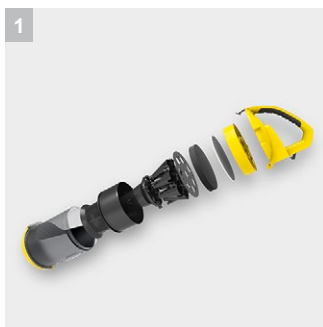
1 Мультициклонный фильтр

Позволяет избежать замены фильтр-мешков и их регулярного приобретения: пылесос VC 3 Floor Premium с мультициклонной технологией, оснащенный прозрачным контейнером для сбора мусора, допускающим промывку.