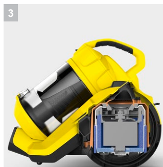
3 Низкий уровень шума